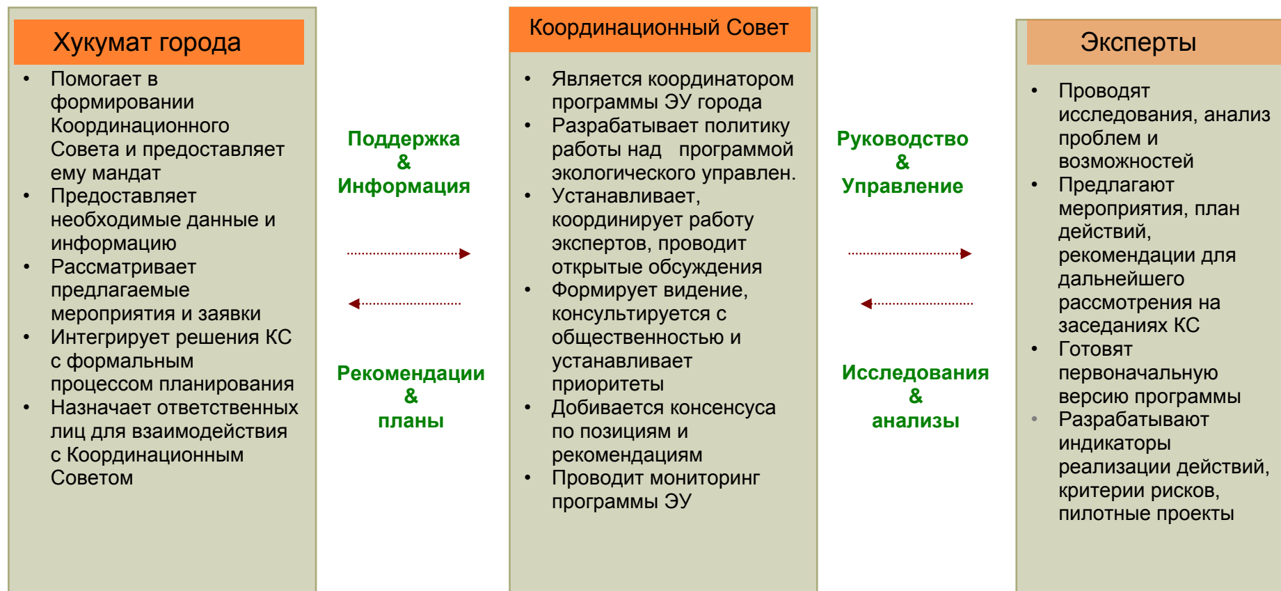
Схема взаимодействия местных органов власти и Координационного Совета